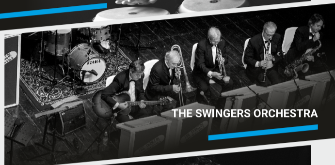
THE SWINGERS ORCHESTRA