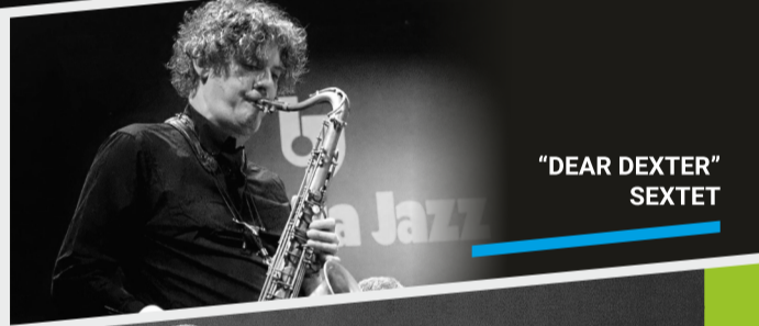
"DEAR DEXTER" SEXTET